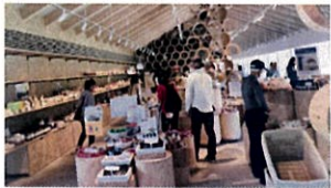
⑦楽しいお買い物コーナー 豊富な品揃え。ホテル鹿角の商品コーナーもあります。

ホテルのスタッフが広場の散策路を歩いて、走ってみたら ゆっくり348歩の散歩で4分。ジョギングは2分30秒で1周でした。 歩幅からの推測で、たぶん1周は180m位と思います。