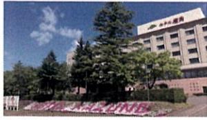
①道の駅の入り口から振り返ると 目の前の道路をわたればもうそこはホテル鹿角。