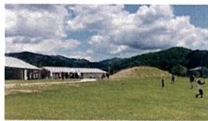
④広場には4mの高さの山 冬になって雪が降ったら「ソリ遊び」を楽しめます。