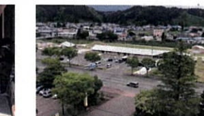
⑩ホテル鹿角のお部屋から 窓辺から見下ろせば6000坪の道の駅が広がります。