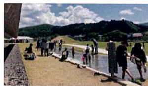
⑤温泉「じゃぶじゃぶ池」 子供達が大喜び、歓声を上げて温泉と戯れています。