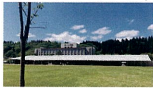
③道の駅の全景 背景にホテル鹿角、一体となり美しく映えています。