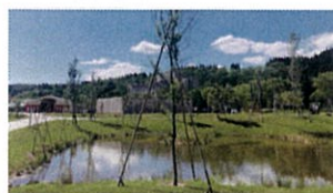
⑥ビオトープ 大湖の生態系を大切に保護。夏は蛍も飛びかいます。