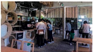
⑧人気のカフェ 鹿角牛のハンバーガーやソフトクリームも好評です。