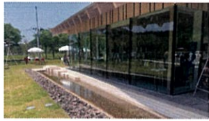
②足湯でほっこり。 ホテル鹿角と同じ源泉、とても泉質の良い温泉です。