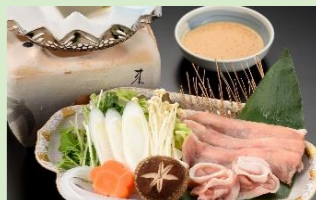
④八幡平ポークしゃぶしゃぶ