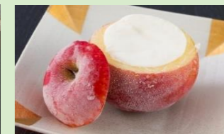
リンゴシャーベット 990円(税込)