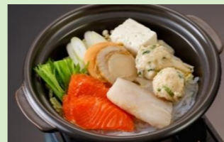
②魚介と鶏団子の塩ちゃんこ鍋