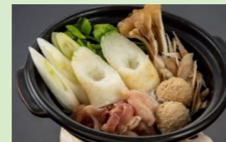
①比内地鶏のつくね入りきりたんぽ鍋

1団体様同一のチョイスとなります。5日前までのご予約をお願いいたします。 ※来満さまコース、小町コースのみとなります。