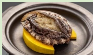
アワビ踊り焼き 3,300円(税込)